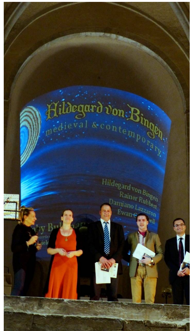
Prämierung des Kompositionswettbewerbs in der Abbazia S. Giovanni in Venere 29. September 2012

Mit einem Grußwort wandte sich der Vizedirektor des Presseamts des Heiligen Stuhls, Padre Ciro Benedettini , in einer Videokonferenz zur Eröffnung des Festivals am 28. September an die Festivalgäste und betonte die Wichtigkeit der Initiative der Festivalorganisatoren, Hildegard und ihre Musik einem breiten Publikum zugänglich zu machen.